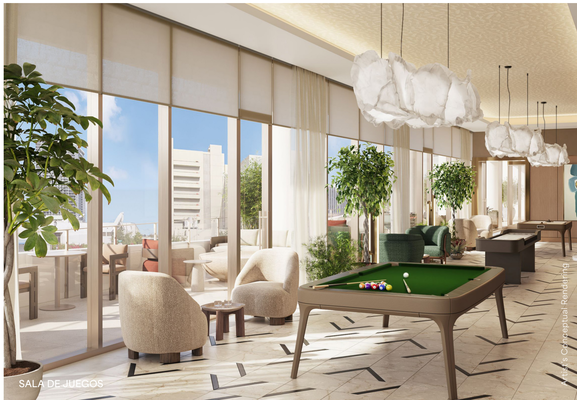
SALA DE JUEGOS