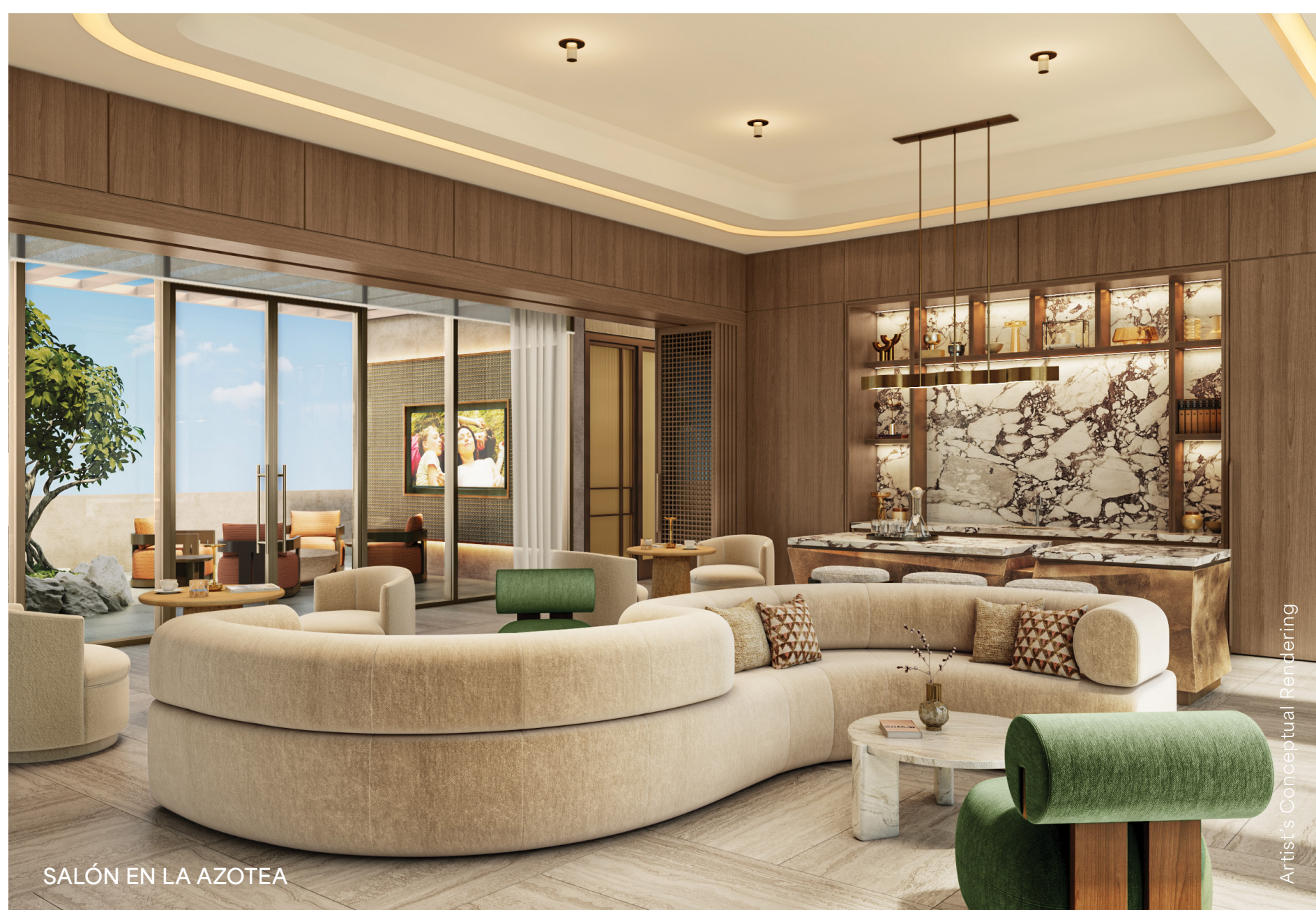
SALÓN EN LA AZOTEA