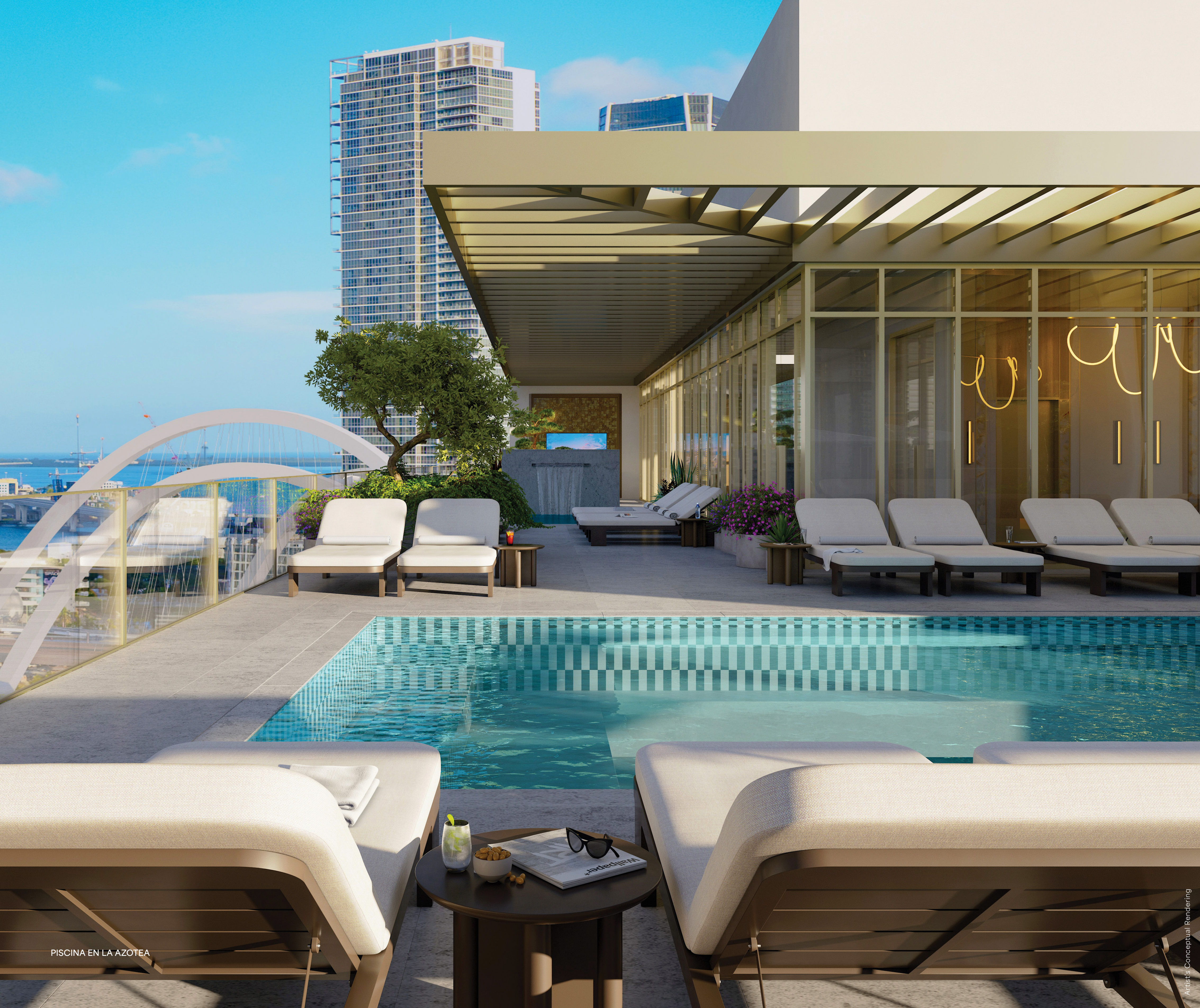
PISCINA EN LA AZOTEA