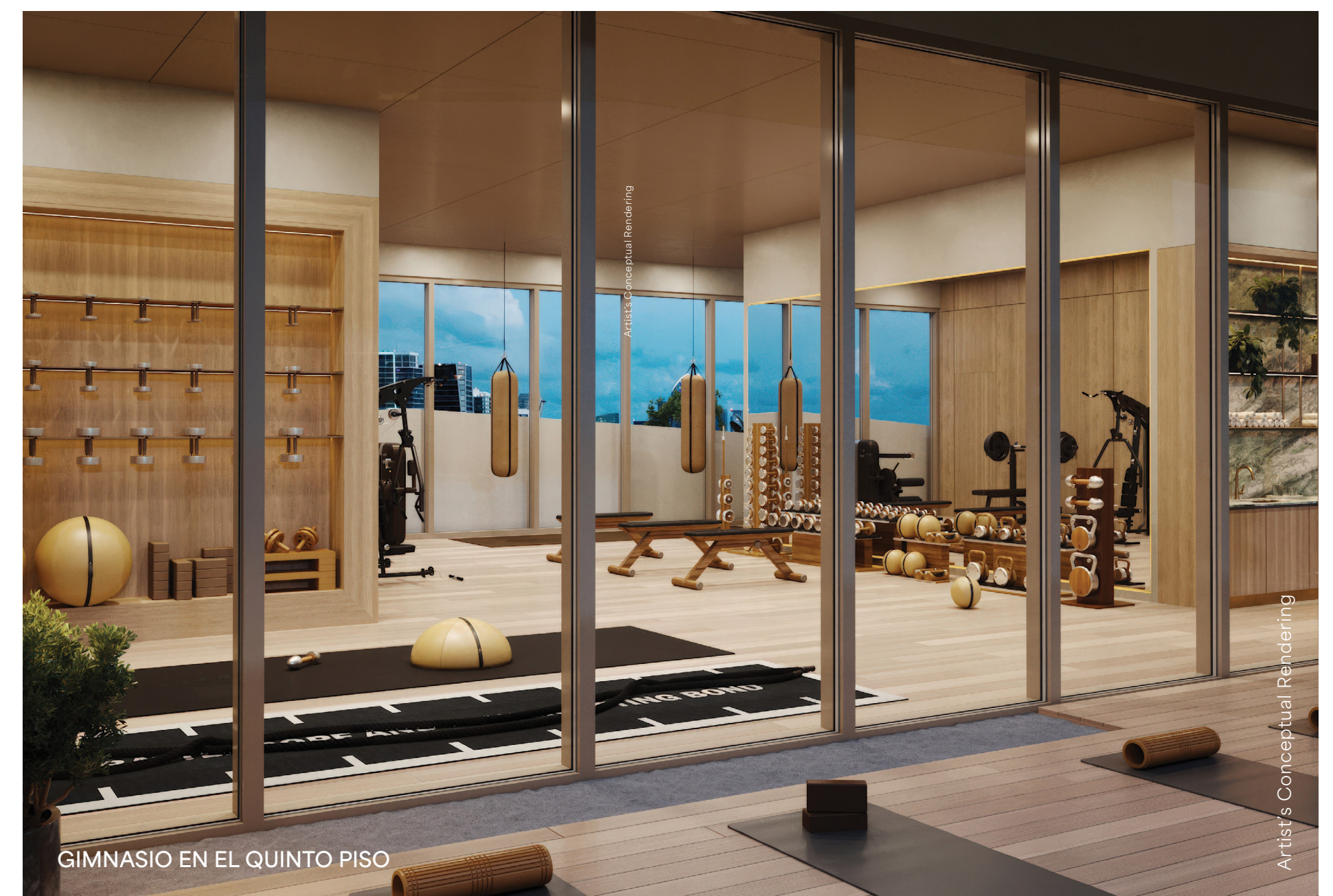
GIMNASIO EN EL QUINTO PISO